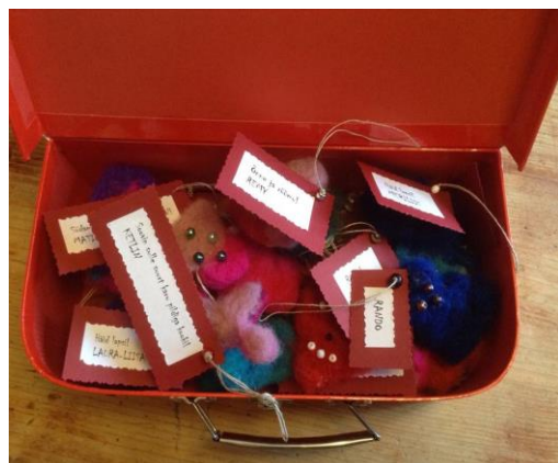
Komplekt vilditud kaunistusi kingituseks